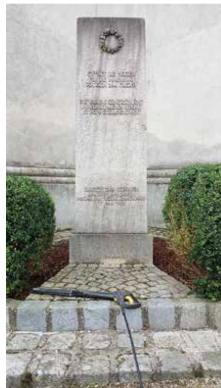
Der Gedenkstein links vor und rechts unmittelbar nach der Oberflächenreinigung

Fotos: ÖKB OV Großrußbach u. Umg., E. Grabler, 21./22.05.2024