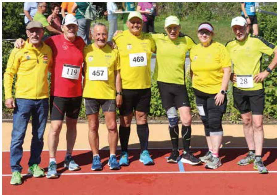
KFC Teilnehmer „Die Gelben“ beim Lauf in Mistelbach