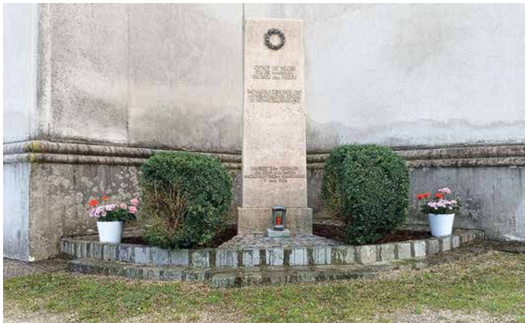
Der Gedenkstein nach den Säuberungsarbeiten und der Reinigung des großen Steines

Pflege der Kameradschaft, soziales, karitatives und kulturelles Engagement, Stärkung des Wehrgedankens, Ehrung der Toten, Bau und Wartung der Kriegerdenkmäler im geografischen Bereich des Ortsverbandes.