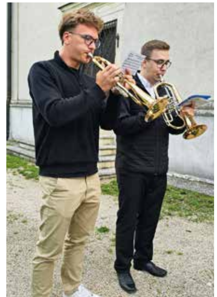
Der Kranzträger bringen den Kranz zum Denkmal, wo zwei Trompeter den „guten Kameraden“ spielen