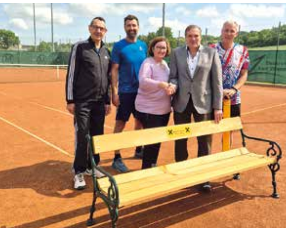
Übergabe der Holzstuhlbänke