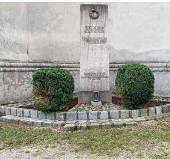
Der Gedenkstein nach dem Jäten des Unkrauts und dem Zurückschneiden des Buchsbaums.

Das Umfeld des Denkmals wurde im heurigen Jahr vom schier endlos wachsenden Unkraut befreit. Frischer Rindenmulch wurde eingebracht, der Buchsbaum zurückgeschnitten, die Waschbetonplatten und Pflastersteine gereinigt sowie ist diesmal auch der große Stein des Denkmals, dem die Natur in den letzten 26 Jahren