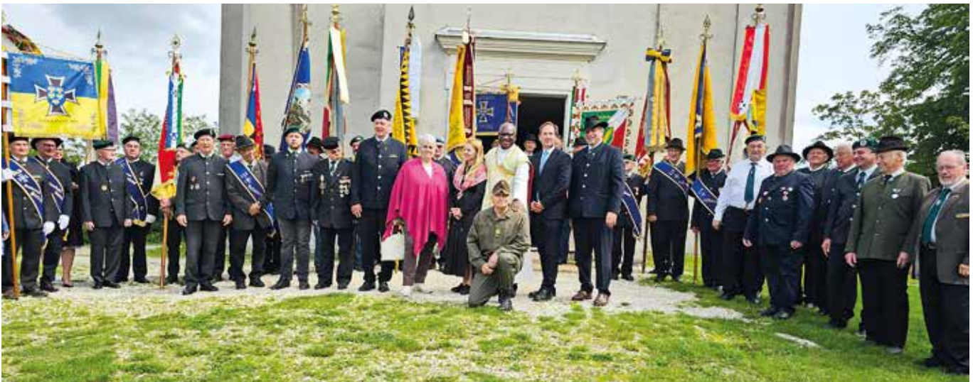
Gruppenfoto vor dem Portal der Wallfahrtskirche Karnabrunn nach dem Ende der Feierlichkeit