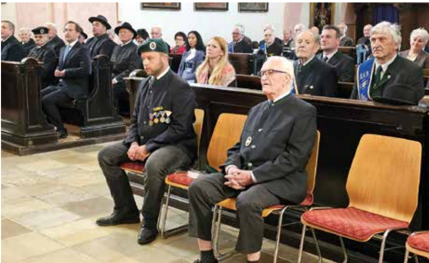
Blick auf die Ehrengäste und Abordnungen in den Bänken der Wallfahrtskirche